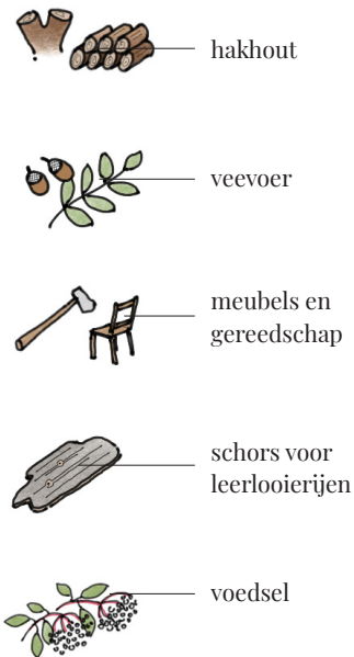
Afbeelding: Cultuurhistorisch gebruik van bos in polder Nijbroek

Het Boerdambos geeft een blik op de eeuwenoude geschiedenis van het gebruik van bos. Je ziet de sporen van het nut van bomen en struiken. Zo werden er bomen gekapt voor hakhout. Het hakhoutverleden van het Boerdambosje is goed te zien aan de verdikte of grillige stamvoeten van de bomen. Ook werd het hout gebruikt voor het maken van o.a. meubels en gereedschap. Daarnaast werden bladeren en eikels vaak gebruikt als veevoer in de winter. Boomschors was nuttig voor leerlooierijen in de omgeving. Verder boden de bessen- en bramenstruiken voedsel voor de grondeigenaren.